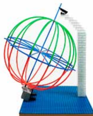
Modélisation de la Terre en ConstruMath

30 jeux de Tangram , pour toute la classe.